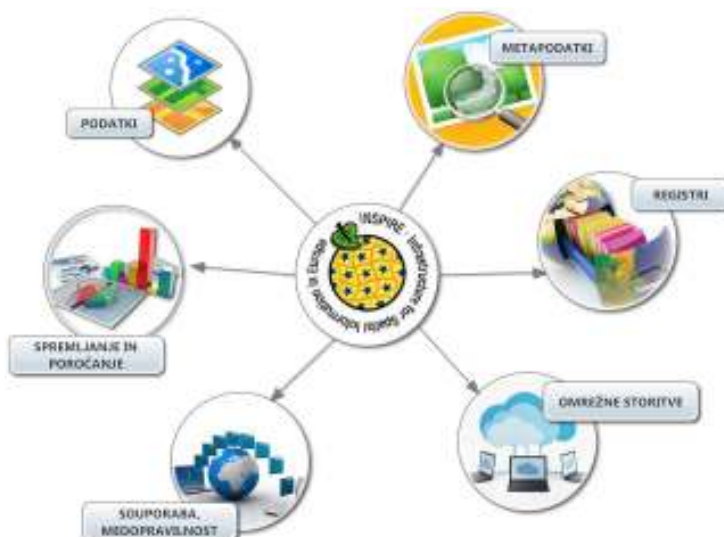
Slika: Sestavni deli infrastrukture za prostorske informacije