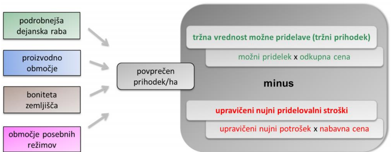
Slika 1: Princip določitve KD